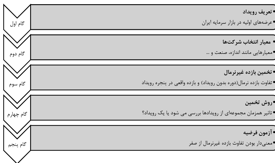
شکل ۱. گام‌های رویداد پژوهی

یک پژوهش بر مبنای رویداد پژوهی شامل تعریف رویداد، تعیین معیارهای انتخاب، محاسبه بازده نرمال و غیر نرمال، روش تخمین، آزمون فرضیه و تفسیر نتایج و نتیجه‌گیری می‌باشد (کمپل و مک کینلی ۱ ، ۱۹۹۷). شکل ۱ گام‌های انجام رویداد پژوهی را به صورت خلاصه نشان می‌دهد و در ادامه توضیح هر کدام از گام‌ها به تفصیل آماده است.