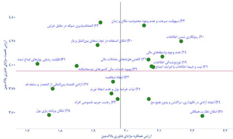
نمودار ۳. بررسی اهمیت-عملکرد مزایای حاصل از فناوری زنجیره‌بلوکی